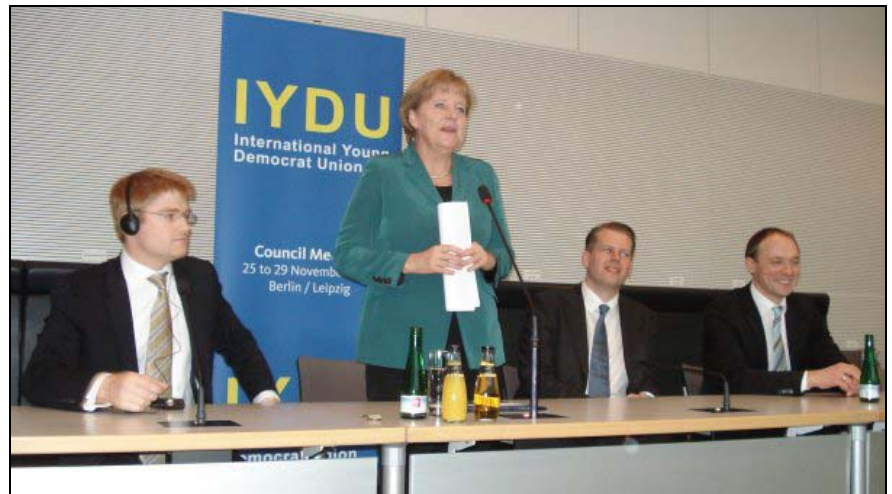
Marco Wanderwitz gemeinsam mit Bundeskanzlerin Angela Merkel dieser Tage beim Jahrestreffen der International Young Democrat Union (IYDU) - über 130 Nachwuchspolitiker aus der gesamten Welt diskutierten über gemeinsame politische Aufgaben.

Die Ergebnisse waren aus deutscher Sicht weniger als erhofft. Wer Kopenhagen aber nur schlecht redet, beteiligt sich am Geschäft derer, die bremsen statt voranzugehen. Klimaschutz ist für uns gleichermaßen Bewahrung der Schöpfung und Gebot ökologischer Vernunft, denn ohne rechtzeitige und wirksame Begrenzung der Erderwärmung drohen schwerste Belastungen und Schädigungen. Klimaschutz ist für uns aber auch eine große Chance für technologische Innovation und die Sicherung von Wohlstand und Lebensqualität. Und vom Klimaschutz werden global notwendige Investitionen ausgehen und enorme Impulse für qualitativ hochwertiges und nachhaltiges Wachstum ausgehen. Unsere Wirtschaft ist dafür in Position, vielfach als Weltmarktführer. Unsere Vorreiterrolle im Umwelt- und Klimaschutz hat inzwischen viele andere Länder angeregt, ihre eigene Politik zu überdenken und zu ändern. Deutschland hat für den nächsten Schritt beim globalen Klimaschutz eine besondere Verantwortung. Auf Kopenhagen muss aufgebaut werden. Das wird die Bundesregierung auf einer Klima-Konferenz Mitte 2010 in Bonn tun.